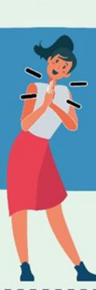
JUNTANDO LAS MANOS